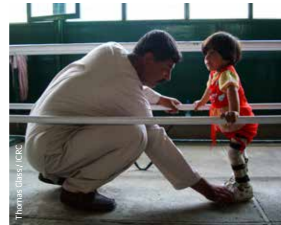
Flere får hjelp: I 2018 fikk over 12.000 nye pasienter hjelp på Røde Kors' ortopediske senter i Afghanistan.

tidligere pasienter. De har fått hjelp til utdanning, og jobber i dag som fysioterapeuter, sykepleiere, teknikere eller kontorarbeidere.