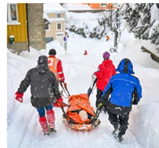
Her blir den blinde kvinnen, som var tom for viktig medisin, fraktet til en bil som kjørte henne hjem.

hver dag. På det verste ble 400 henvendelser avstått på en dag, fordi det ikke var kapasitet nok til å hjelpe alle.