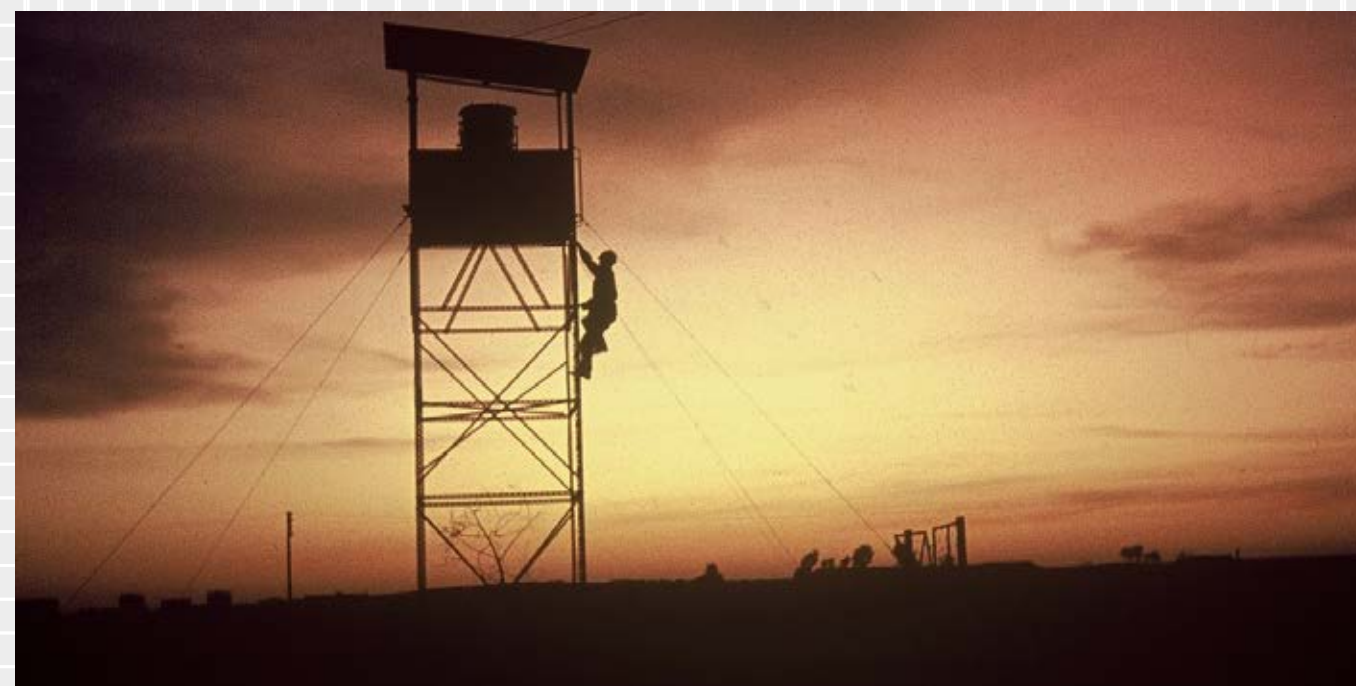
Eilif Torma var vernepliktig grensevakt i Gaza i 1963/64 som FN soldat.