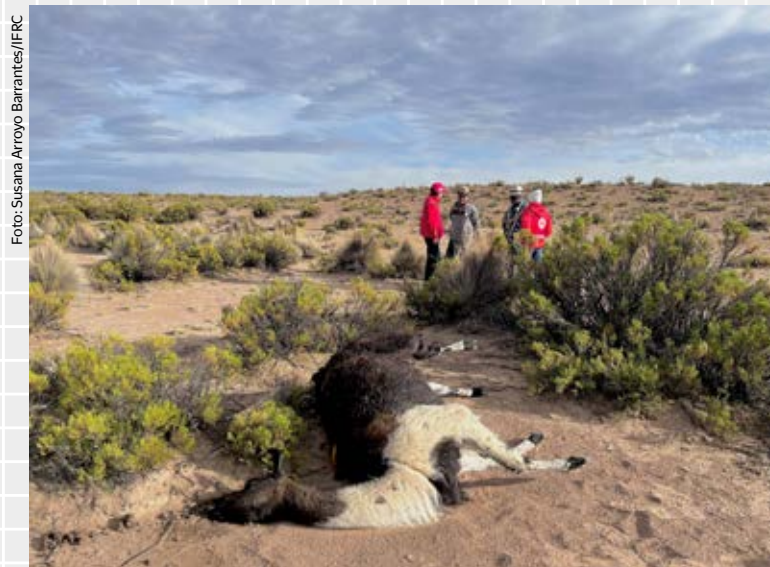
En gang fruktbare områder over hele den vestlige regionen av Bolivia har blitt redusert til støv.

Kolera er både svært smittsom og dødelig. Det er avgjørende å erstatte væsketapet raskt, og få rehydreringssalter.