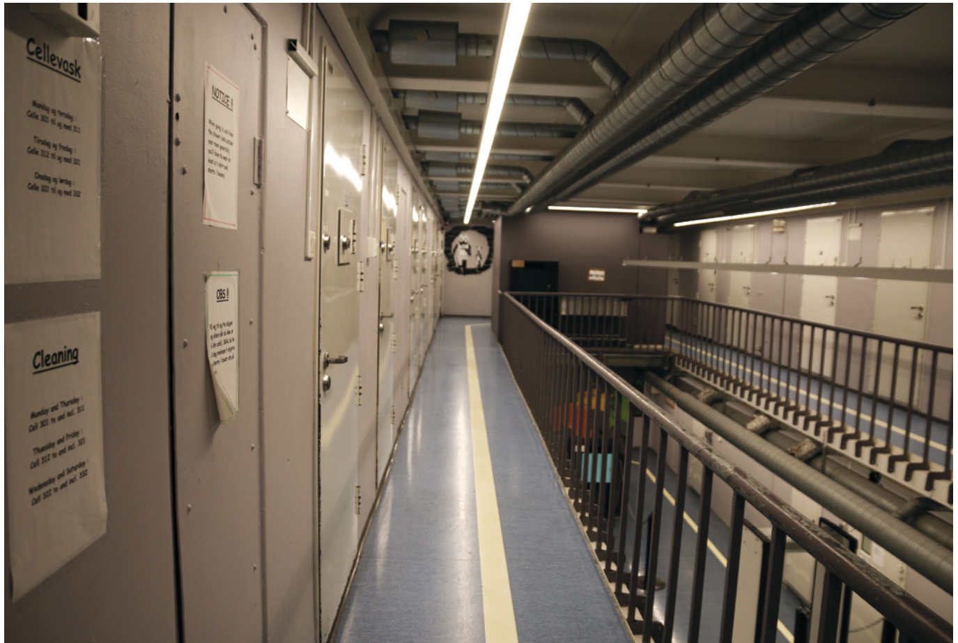
Celler på rekke og rad i Oslo fengsel