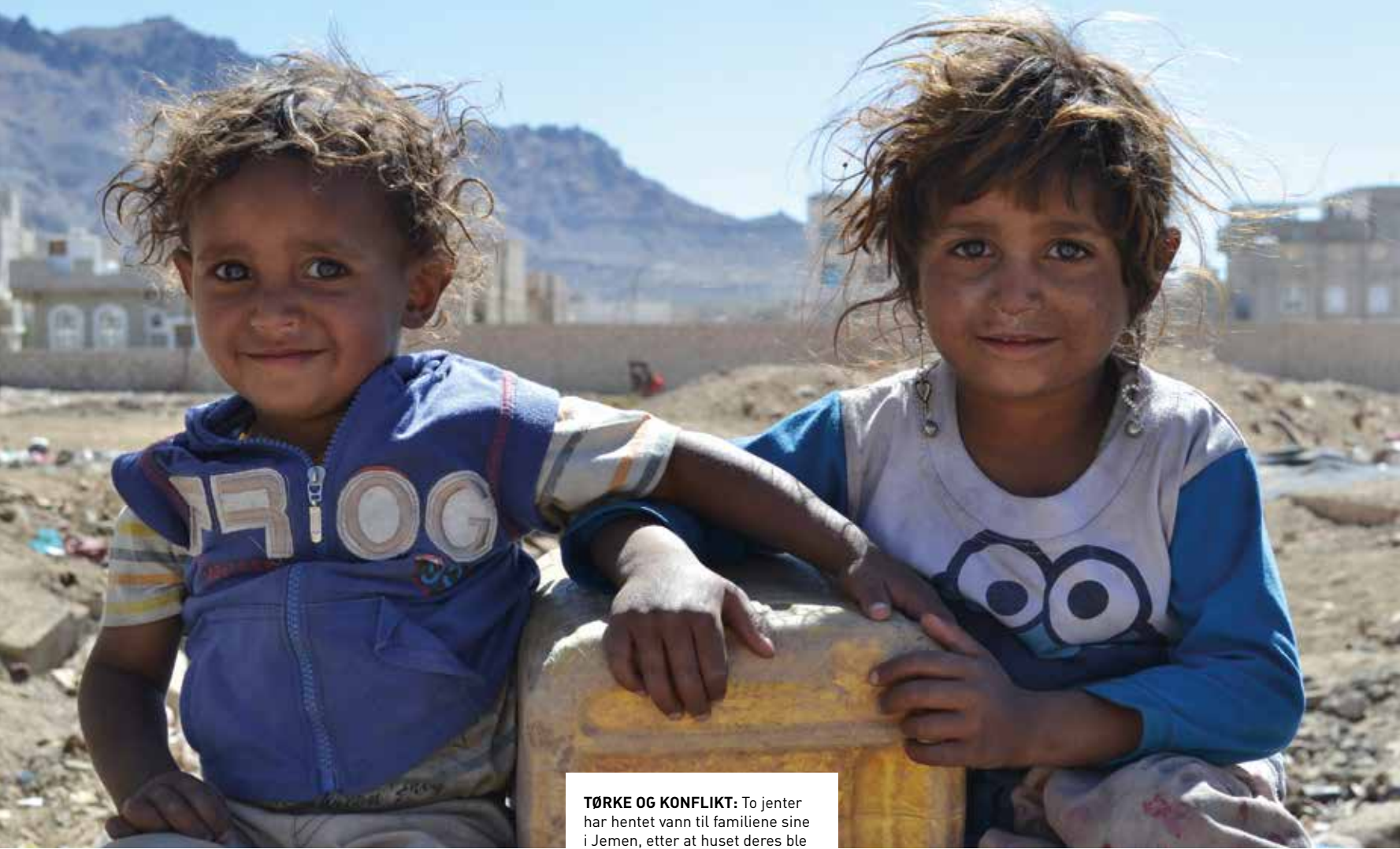
TØRKE OG KONFLIKT: To jenter har hentet vann til familiene sine i Jemen, etter at huset deres ble ødelagt. En mor henter vann i Somaliland. Røde Kors bistår med distribusjon av mat og vann.