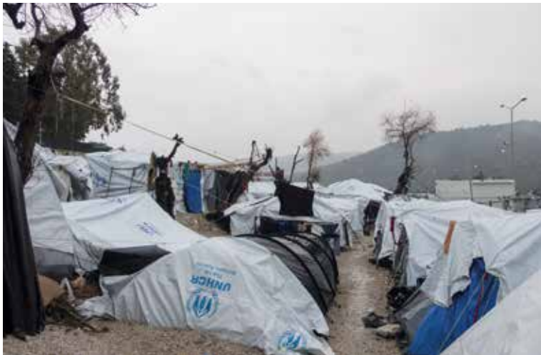
DÅRLIGE FORHOLD: I flyktingleiren Moria er det svært dårlige forhold. Leiren er overfylt og brannfaren er veldig stor. Migrantene bor tett i tett i telt, og mange har vært der så lenge som 10 måneder.