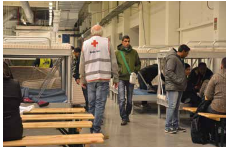
TRYGGHET: Flyktingene som kommer til Norge fra Hellas og Italia blir fraktet til ankomstsenteret på Råde i Østfold. Frivillige fra Røde Kors er til stede for å gi flyktingene en trygg og varm velkomst i Norge.