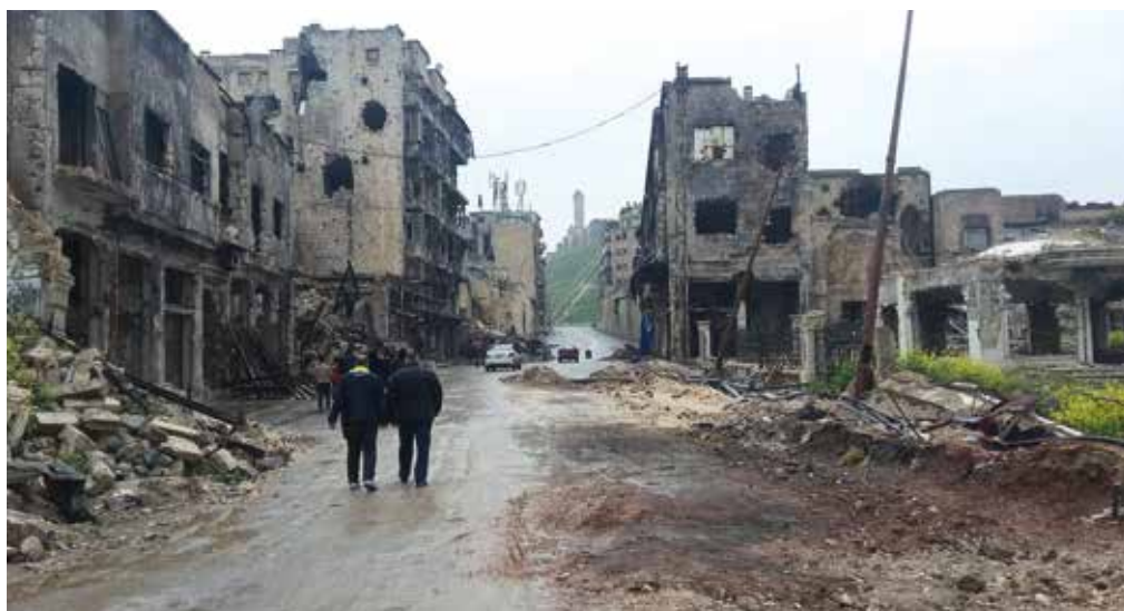
Tekst: Olav A. Saltbones

Mer enn halvparten av innbyggerne i Syria har flyktet, enten ut av landet, eller til andre områder i sitt eget hjemland. 6 år med borgerkrig har tatt mange liv, og ødelagt enda flere.