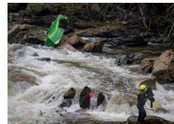
Rundt 60 frivillige deltok i aksjonen.