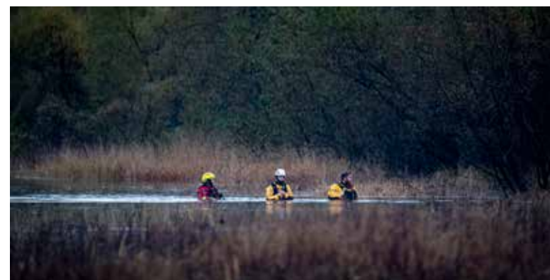
Elveredningsgruppen i Eid Røde Kors har spesialisert seg på søk og redning i elver, stryk og vann.