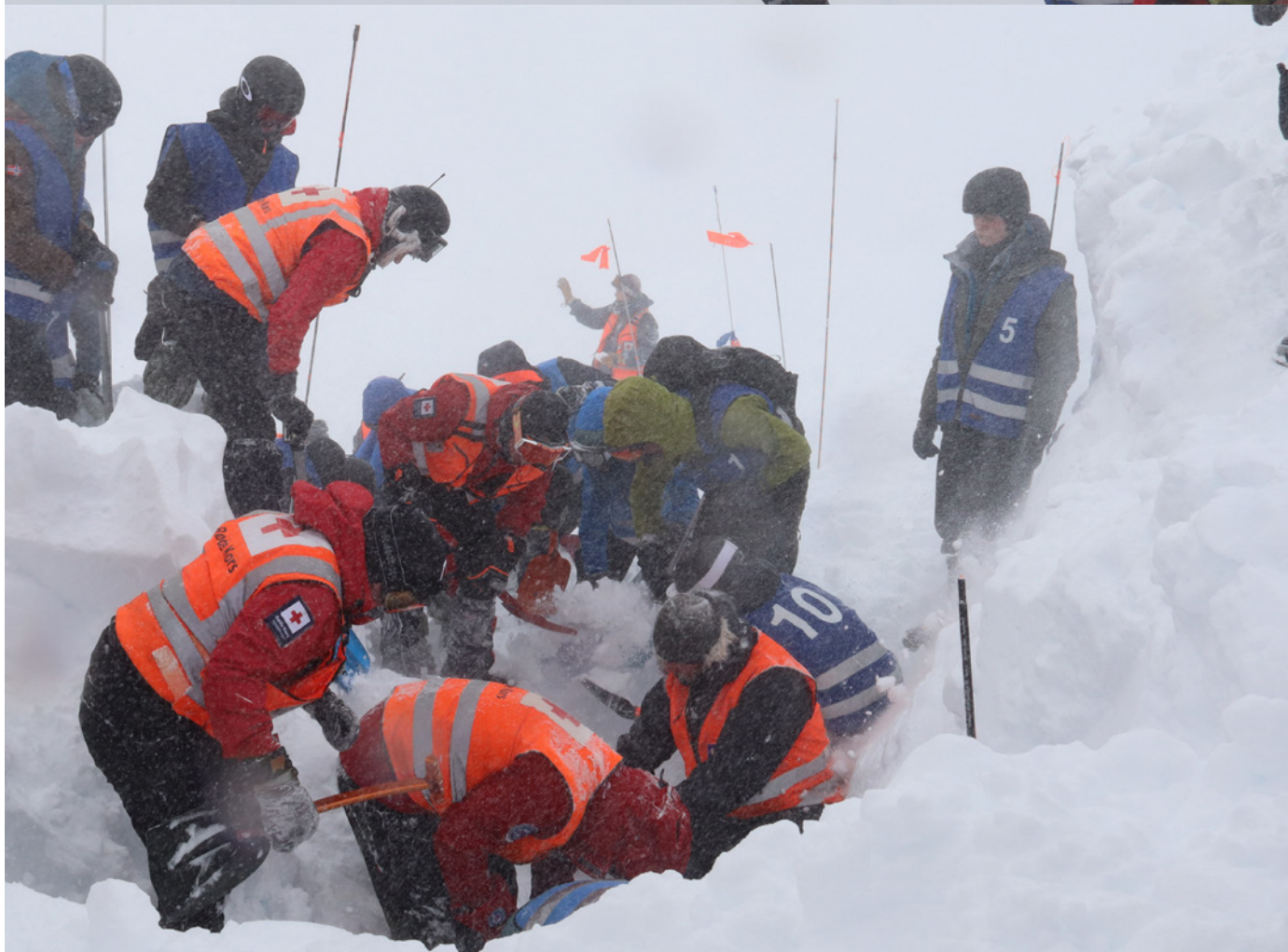
Finsekurset 2023: Deltakere fra Røde Kors, politiet, Norske Redningshunder og friluftslinja ved Voss jordbruksskule gjennomfører snøskredøvelse.