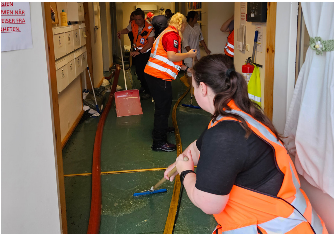
Frivillige fra Østre Toten Røde Kors Hjelpekorps bistår i opprydningen etter at ekstremværet «Hans» førte til oversvømmelse på en institusjon på Eina.

Både hjelpekorpsere og frivillige fra flere av omsorgsaktivitetene til Røde Kors deltok i dette arbeidet. Hjelpekorpserne ble stort sett sendt på oppdrag som krevde spesialisert førstehjelps-kompetanse, mens frivillige fra for eksempel Besøktjenesten og Barnas Røde Kors var til stede og hjalp til på alle andre arenaer. Beredskapsarbeid er mer enn søk- og redning, og i en krisesituasjon er Røde Kors i stand til å være en god støtteaktør for myndighetene nettopp fordi organisasjonen tilbyr så mange forskjellige aktiviteter og tjenester til daglig. Våre frivillige har allsidig kompetanse, og det gjør det mulig for oss å stille opp for myndighetene og løse de oppgavene som det til enhver tid er størst behov for å løse.