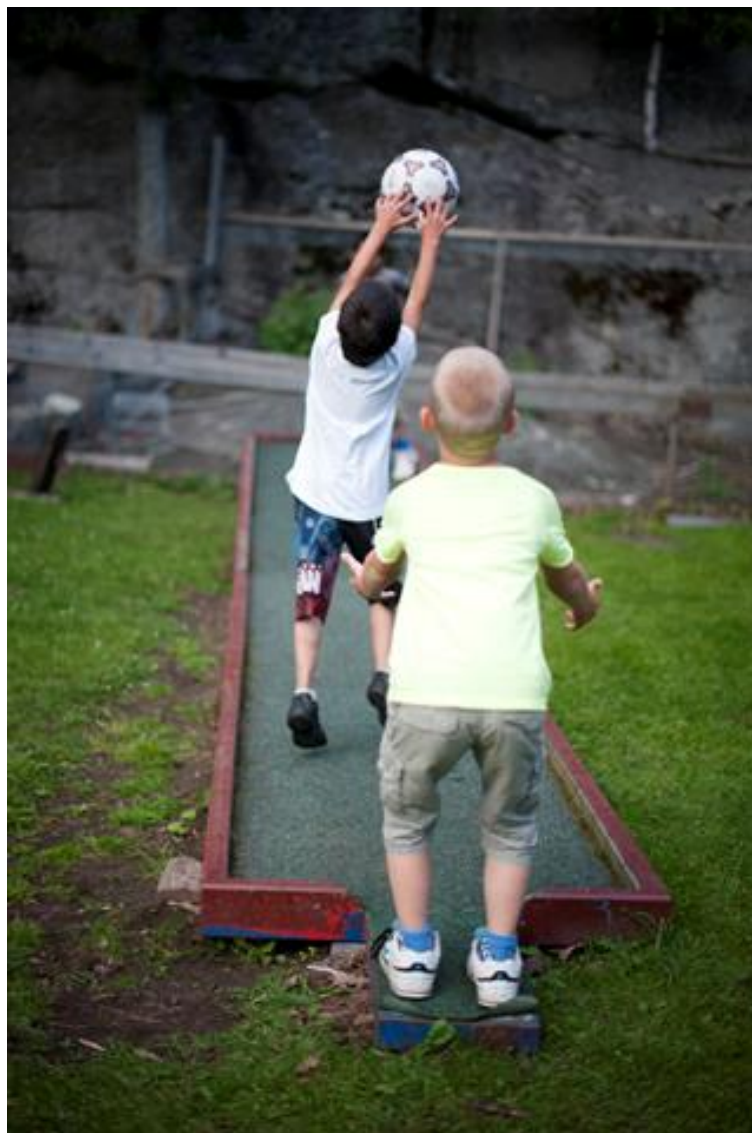
Barn som deltar på Ferie for alle