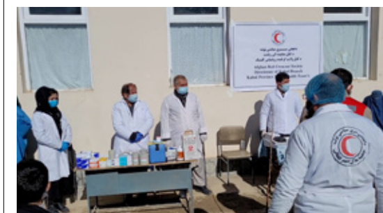
Helseklinikken til Afghansk Røde Halvmåne er mange steder det eneste tilgjengelige helsetilbudet. Her fra klinikken i Mosahi-distriktet i Kabul provinsen.