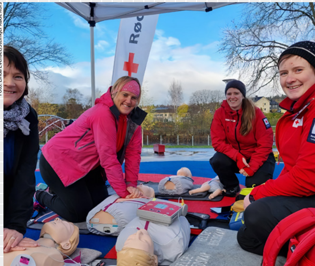
I mai kan du lære deg riktig hjerte-lungeredning og annen viktig førstehjelp.