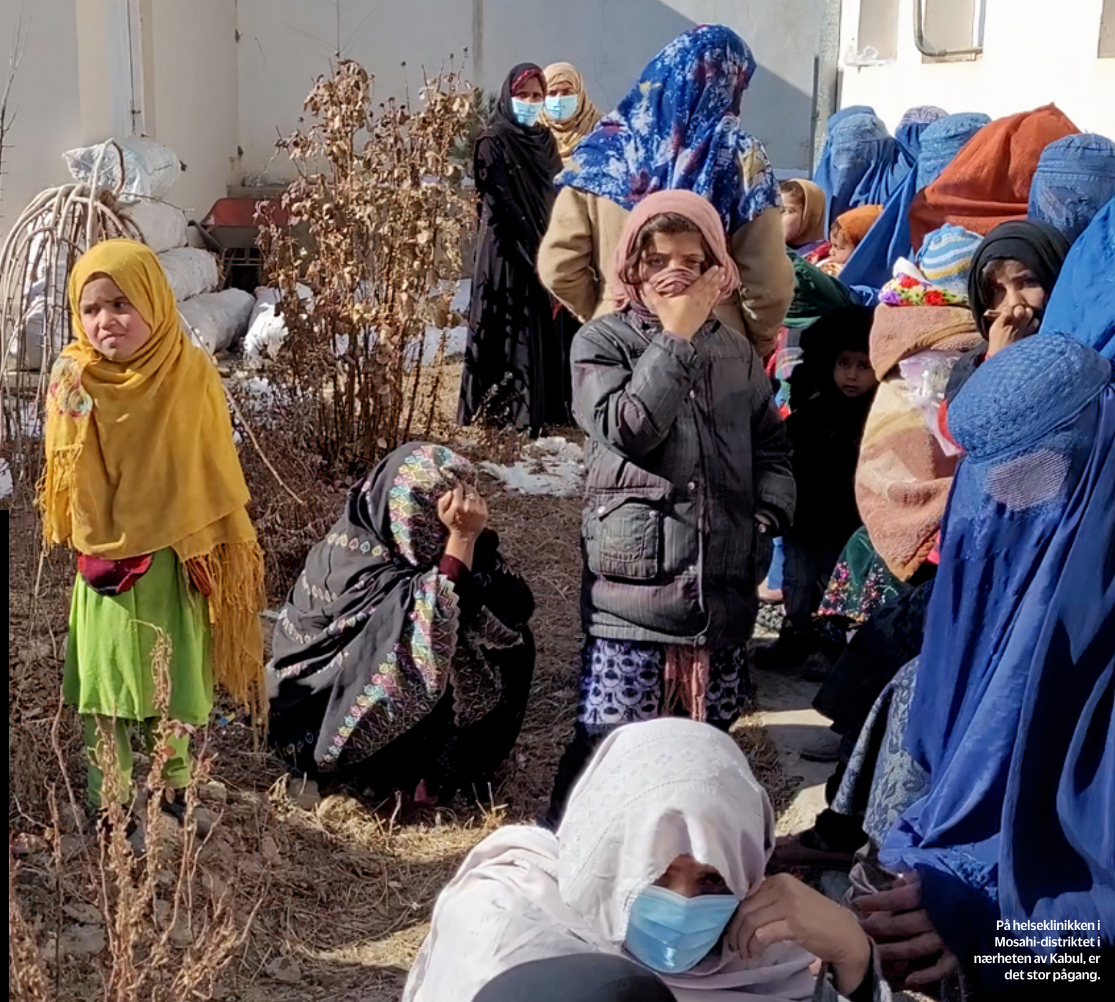
På helseklinikken i Mosahi-distriktet i nærheten av Kabul, er det stor pågang.

Tekst: Olav A. Saltbones