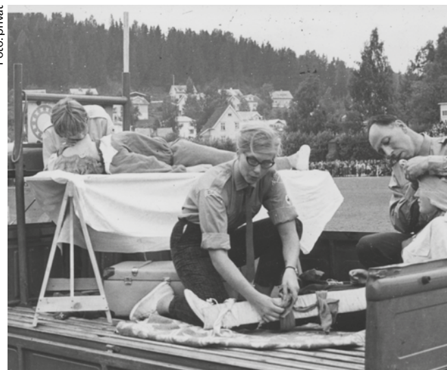
Førstehjelpskurs for hjelpekorps i Gjøvik Røde Kors, ca 1960.