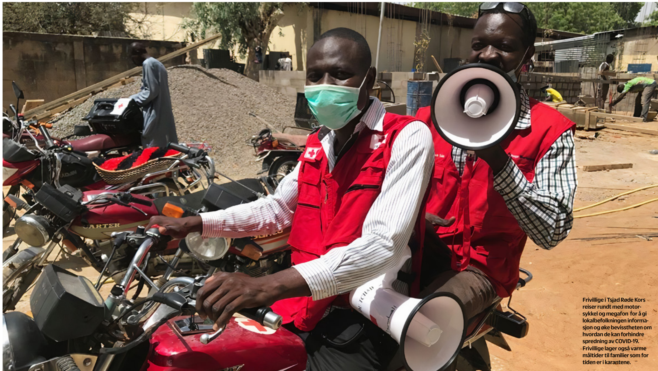
Frivillige i Tsjad Røde Kors reiser rundt med motorsykkel og megafon for å gi lokalbefolkningen informasjon og øke bevisstheten om hvordan de kan forhindre spredning av COVID-19. Frivillige lager også varme måltider til familier som for tiden er i karantene.