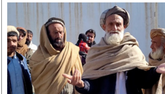
En av de eldre i landsbyen forteller at de er bekymret for at de ikke er noe helsetilbud i området på natten.