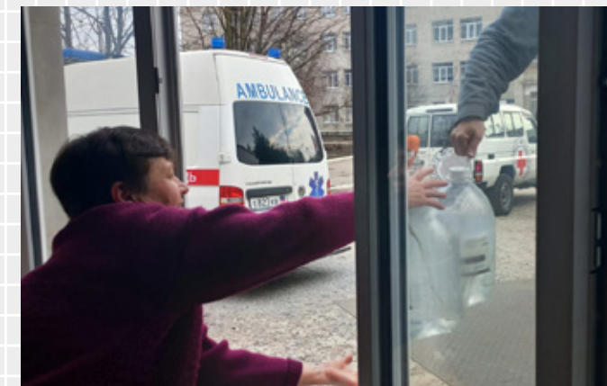
Foto: ICRC/Ukraina Røde Kors leverer ut flere tusen liter drikkevann til Dokuchaevsk sykehus.