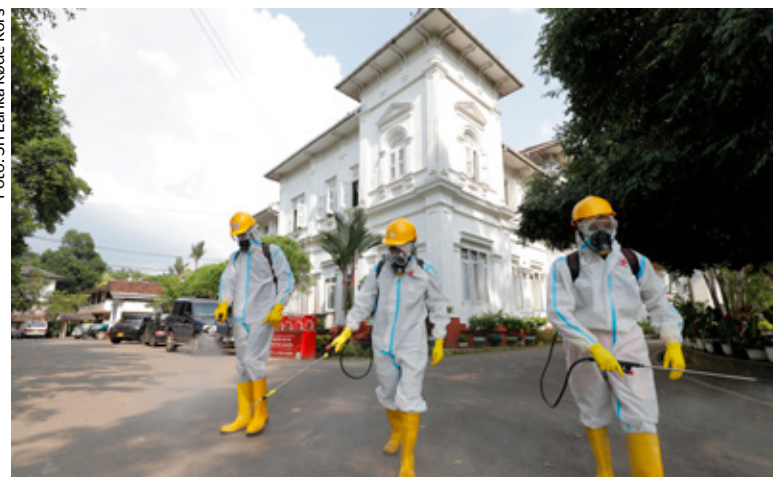
Helseteam fra Sri Lanka Røde Kors sprayer gatene med desinfeksjonsmiddel i Gampaha-distriktet i nærheten av hovedstaden Colombo.

– Frigiving av patentrettigheter og oppbygging av produksjonskapasitet der behovene er størst vil ha stor betydning. Donasjoner av vaksiner fra rike land er helt nødvendig. Vaksinen ble utviklet på rekordtid. Nå må vi sørge for at den blir tilgjengelig for alle, også i verdens fattigste land, sier Tønnessen-Krokan.