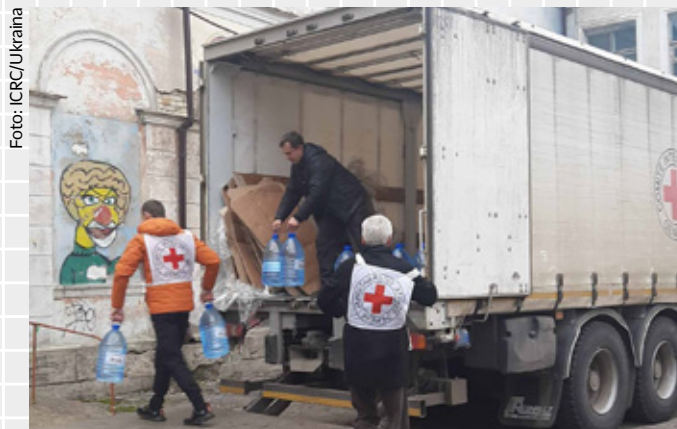
På grunn av vannmangelen distribuerer frivillige fra det lokale Røde Kors drikkevann til viktige serviceanlegg i Donetsk kommune.

Røde Kors-frivillige bistår derfor helsedepartementet med å redusere spredning av det myggbårne viruset. De bidrar blant annet med å sprøyte, rydde og fjerne avfall der myggen kan formere seg, og gi opplæring i helse, hygiene og behandling av den dødelige sykdommen.