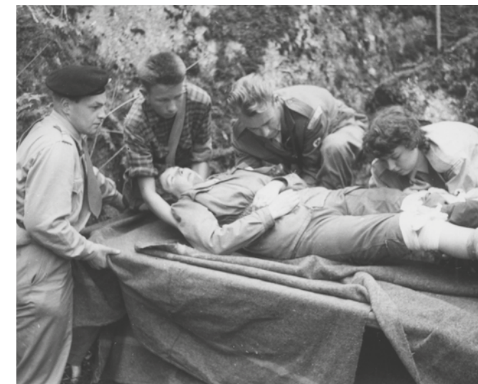
Øvelse i Hof i Vestfold, juni 1957.

Over 43.000 mennesker over hele landet gjør en frivillig innsats for Røde Kors. Vi har spurt tre aktive hjelpekorpsere om hva det betyr å være frivillig.