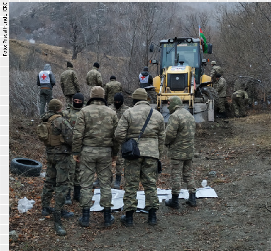
I over ett år har mannskaper fra ICRC lettet etter mer enn 2.000 savnede etter konflikten i Nagorno-Karabakh.