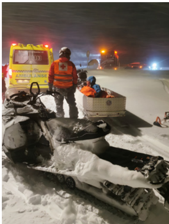
Det ble en dramatisk redningsaksjon med mange aktører involvert.