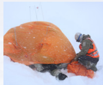
Shelter gir god beskyttelse mot vær og vind for én eller flere personer.