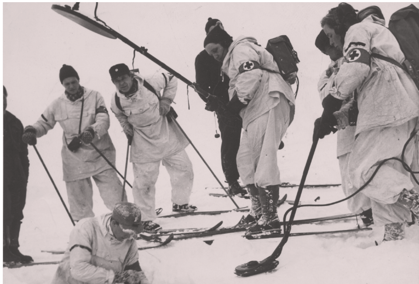
Hjelpekorpsskurs på Rjukan i februar 1950.