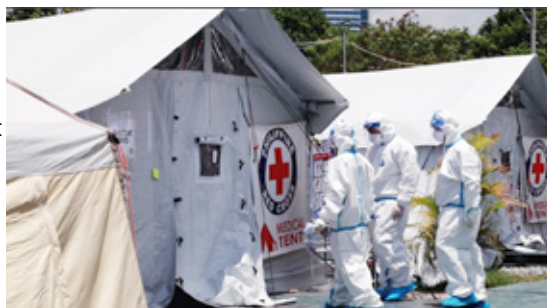
Filippinsk Røde Kors øker responsen for i bidra til å dempe pandemien i landet. De gir blant annet støtte til sykehus ved å sette opp medisinske telt og etablerer vaksinasjonssentre for å vaksinere flere mennesker.