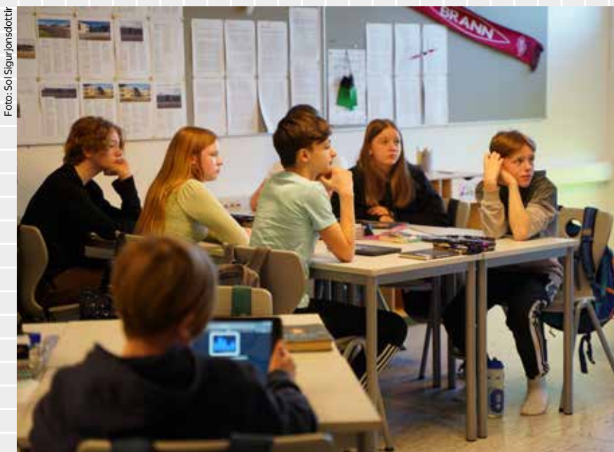
Mange elever har spørsmål om krig og hvilke regler som gjelder. I løpet av de første tre timene regler i krig, kom det inn over 15.000 spørsmål fra elevene digitalt.