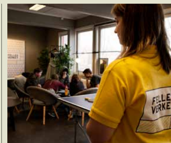
Å ta med de ukrainske flyktingene på vanlige aktiviteter på huset, som for eksempel spill og chill, er én av kongstankene bak integreringsarbeidet til Fellesverket Fratelli.