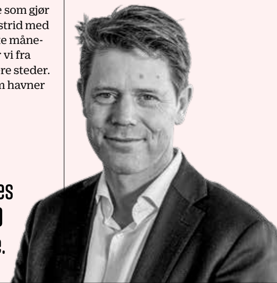
Bernt G. Apeland Generalsekretær i Røde Kors

« Når krig rammer byer, og det brukes eksplosive våpen, er 90 prosent av ofrene sivile.