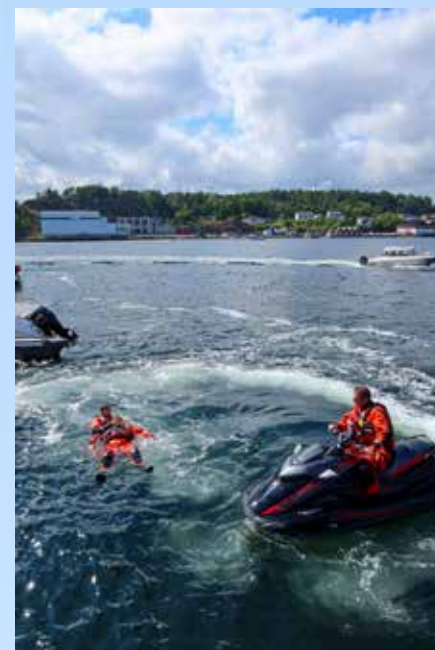
Å beherske vannskuter må det også øves på.