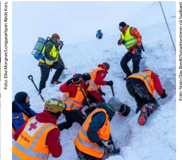
Snøskredøvelser er viktige på Svalbard. Det går skred på stadig nye steder.