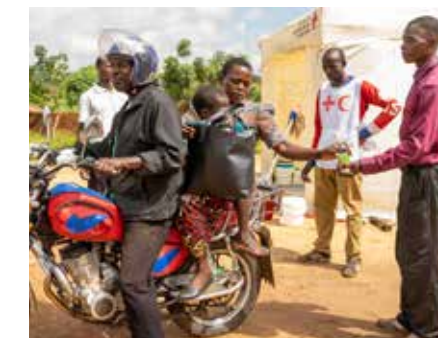
Alvorlige tilfeller henvises til legebehandling. De frivillige organiserer transport med motorsykel til nærmeste klinikk.