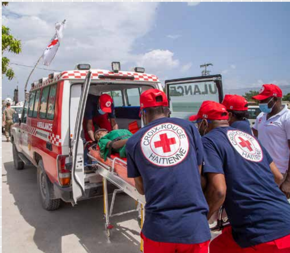
Haitisk Røde Kors ambulansetjeneste bringer en pasient til et sykehus.