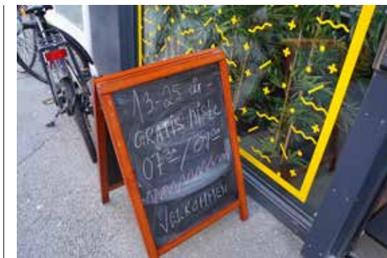
Fellesverket, ungdomshuset i Haugesund, deler ut frokost og lunsj tre dager i uka. Behovene har økt, og tilbudet er blitt svært populært.

Hos Haugesund Røde Kors merker man godt at "Nistå" er blitt et populært tilbud. Mange setter også pris på å kunne spise frokosten sammen med andre på Fellesverket. Om morgenen er det frokostblanding, yoghurt, müsli og frukt.