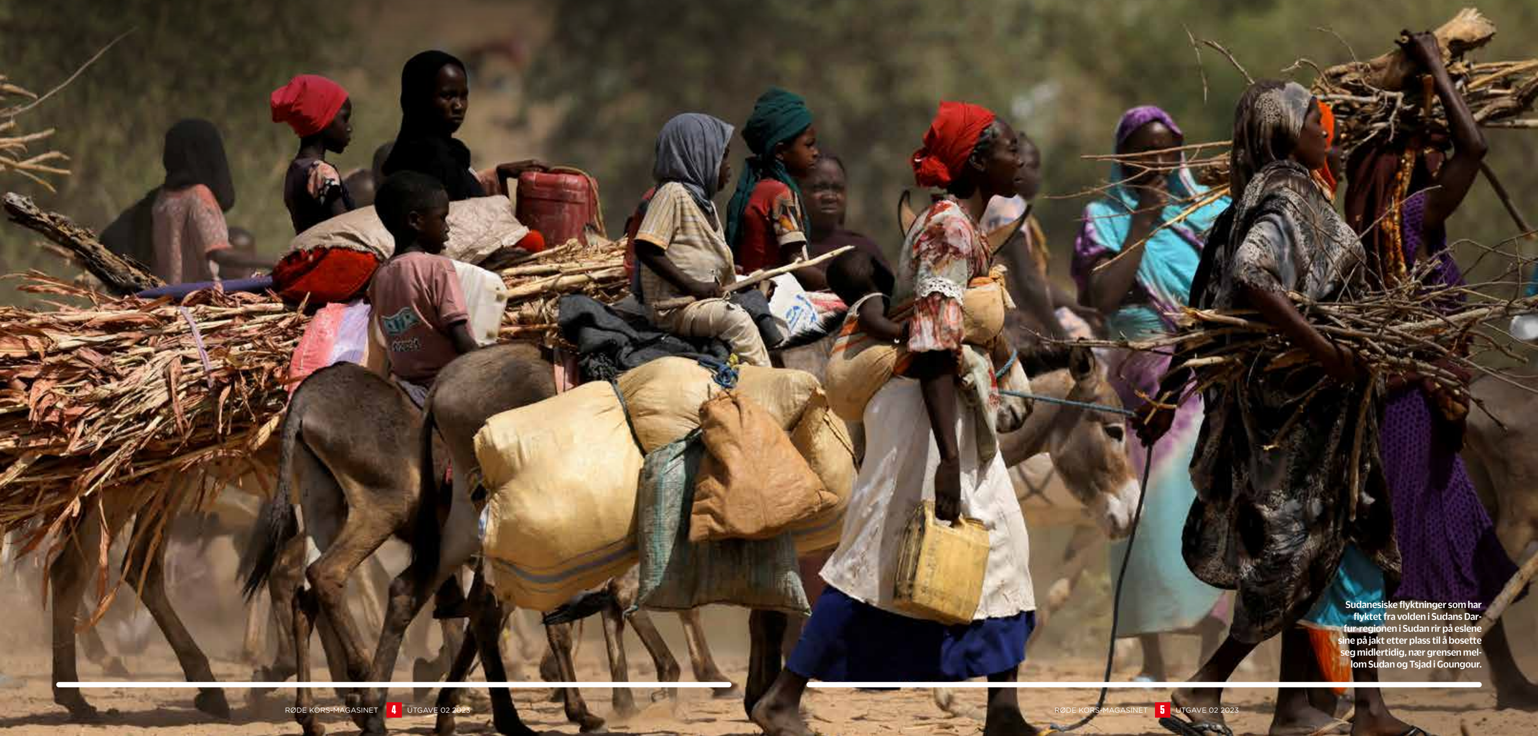
Sudanesiske flyktninger som har flyktet fra volden i Sudans Darfur-regionen i Sudan rir på eslene sine på jakt etter plass til å bosette seg midlertidig, nær grensen mellom Sudan og Tsjad i Goungour.

– Vi fortsetter å gjøre alt vi kan for å levere og oppfordrer alle til å legge til rette for humanitært arbeid. Flere liv kan reddes.