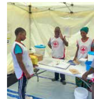
– Det er fint å kunne hjelpe til, nå som så mange er syke, sier de frivillige på koleraposten i Mtanga.