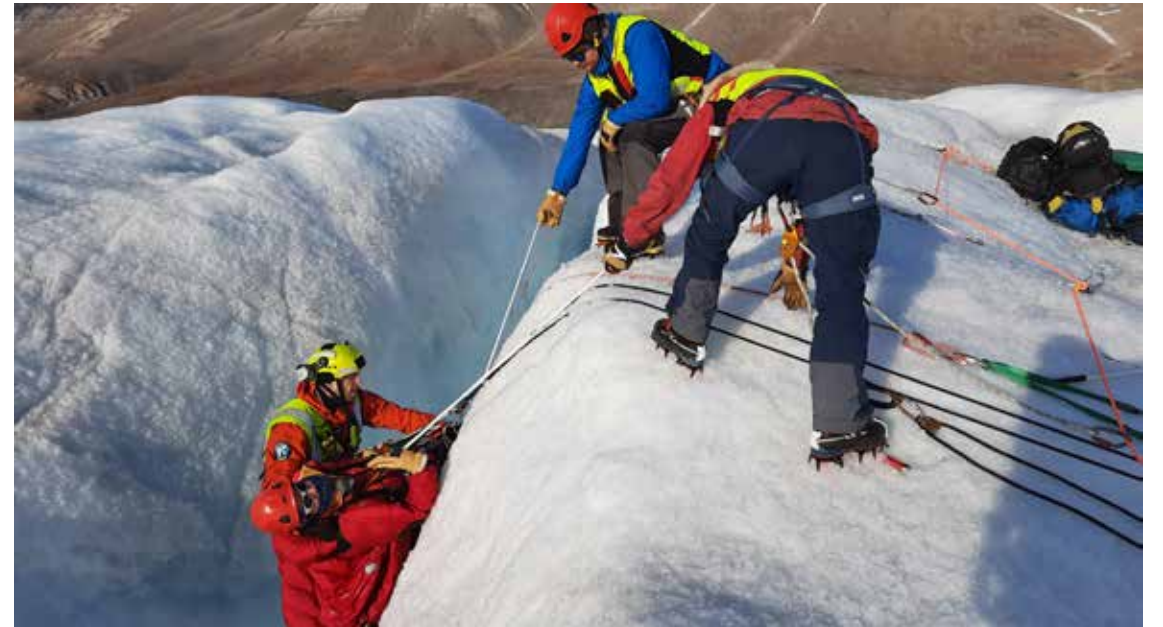
Frivillige fra Longyearbyen Røde Kors på Svalbard øver hyppig på redning i ekstreme omgivelser. Her fra en øvelse i 2021.