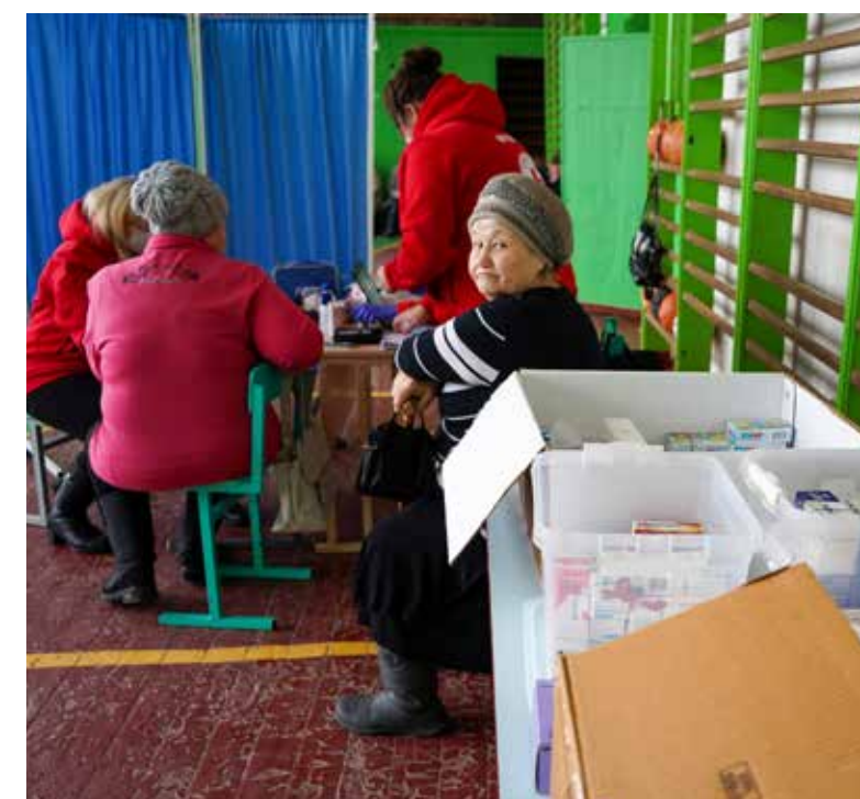
De mobile helseteamene reiser rundt for å gi mennesker grunnleggende helsehjelp. Her får de tilgang på hjelp der hvor de befinner seg.