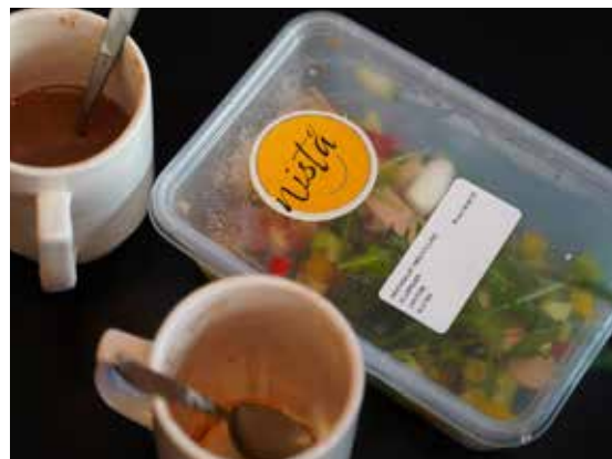
Etterspørselen er blitt så stor, at det nå deles ut 70 matpakker tre dager i uken. I tillegg kan ungdommene spise gratis frokost på Fellesverket.