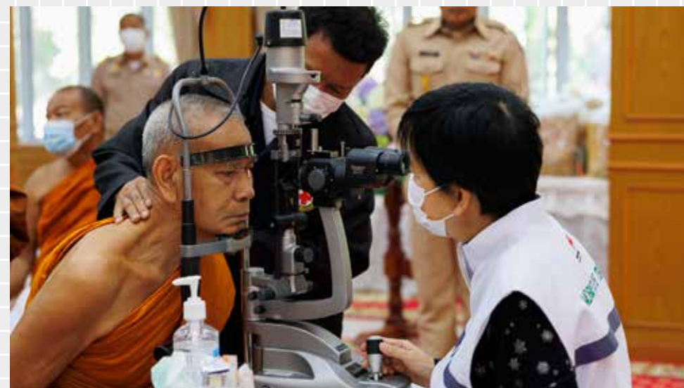
Røde Kors i Thailand har de siste 27 årene drevet en mobil øyeklinikk, hvor de hjelper folk som ellers ikke har råd til operasjon.