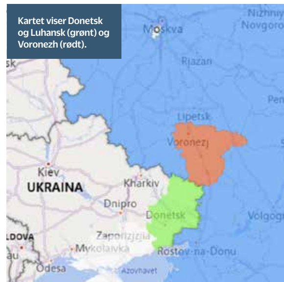
Kartet viser Donetsk og Luhansk (grønt) og Voronezh (rødt).