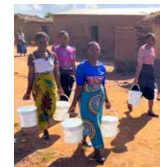
Rent vann er avgjørende for å bekjempe kolera. Hver morgen henter frivillige vann til kolerapostene.