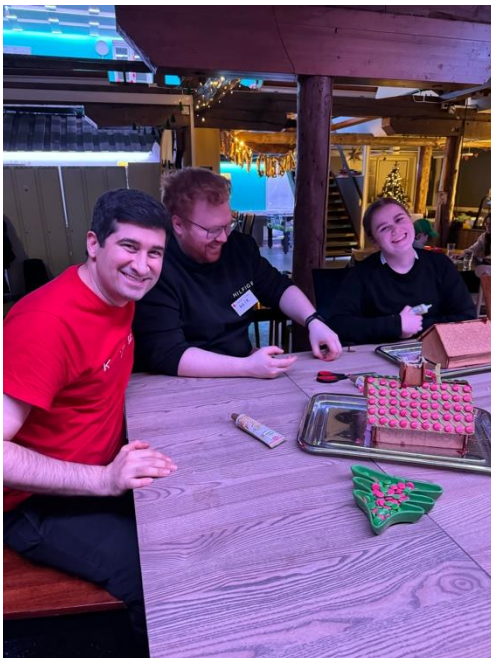
Frivillige på Fellesverket og leder i Tromsø Røde Kors Ungdom pynter pepperkakehus sammen.