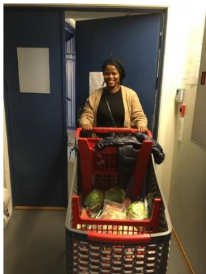
Bildetekst: Bata og Fellesverkets «firmabil».

Ressursgruppen har bestått av: én frivillig fra henholdsvis Fellesverket Tromsø, Tromsø Røde Kors Ungdom og Beredskapsutvalget i Tromsø Røde Kors, samt ansattressurs og to representanter fra Utekontakten i Tromsø kommune.