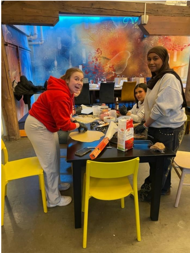
Tromsø Røde Kors Ungdom bakte pepperkaker og kakemenn på juleavslutning.