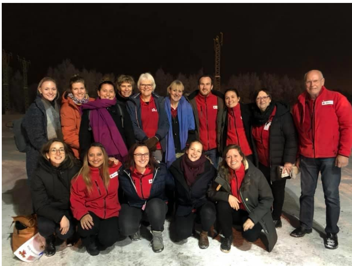
Frivillige fra besøksordningen ifm. julefest på Trandum 2018