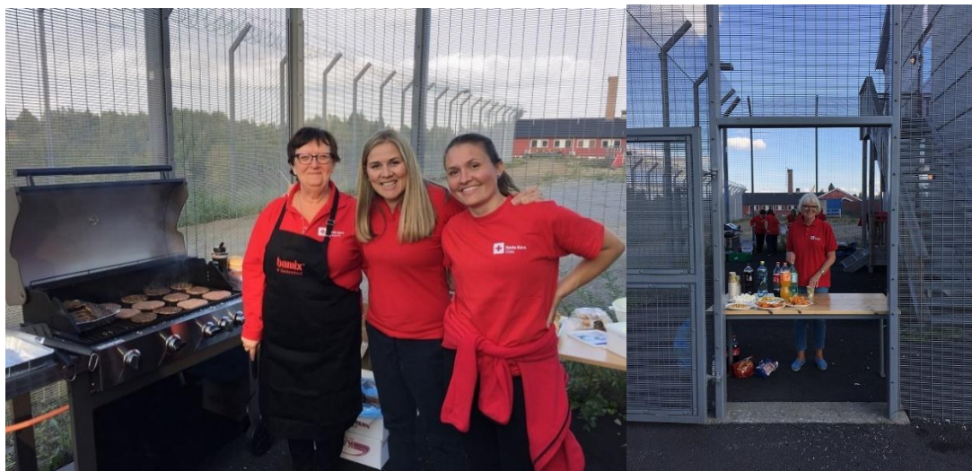
Røde Kors frivillige, grillfest Trandum 2018.