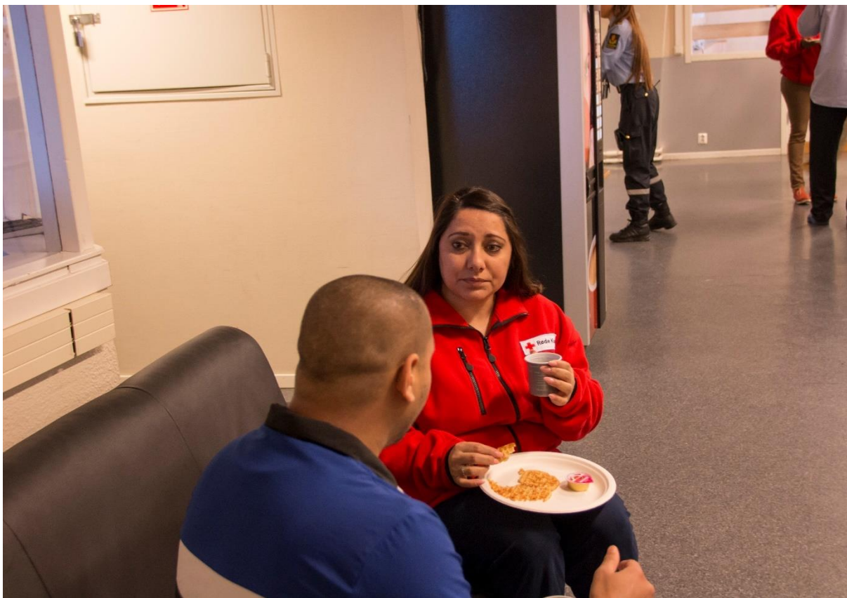
Frivillig i møte med en internert på aktivitetssenteret