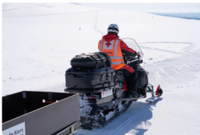
Det har vært få oppdrag for Røde Kors i påsken.