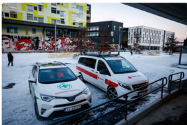
Redningstjenesten og Røde Kors ved studentboligene på Fantoft onsdag morgen.