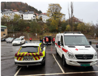
Politiet, med bistand fra frivillige, leter etter en savnet mann i Byfjellene.

Rundt kl. 14.45 lørdag ettermiddag satte politiet i samråd med Hovedredningssentralen i gang en leteaksjon etter en turgåer.