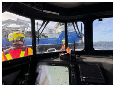
Elever og lærere måtte ha hjelp i forbindelse med en utfartstur i kano i Raunefjorden.