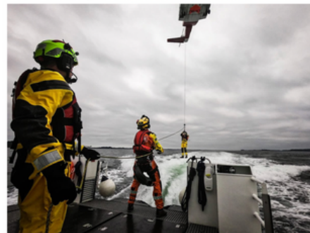
Flust av båter og et redningshelikopter skal øve sammen ved Høllaneset søndag formiddag. Bildet er fra en tidligere øvelse.