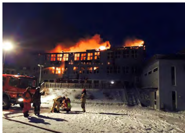
Kolvereid Røde Kors forsynte brannvesenet med utstyr og mat og bistod med trafikkdirigering i forbindelse med brann på Kolvereid skole i morgentimene 14. januar. Skolebarn og lærere fikk låne Røde Kors-huset.